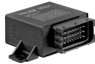
Ventilsteuerung Typ CAN-IO 14+

Die CAN-IO 14 kann durch die umfangreiche Einstellmöglichkeit und Programmiermöglichkeiten sehr flexibel eingesetzt werden.